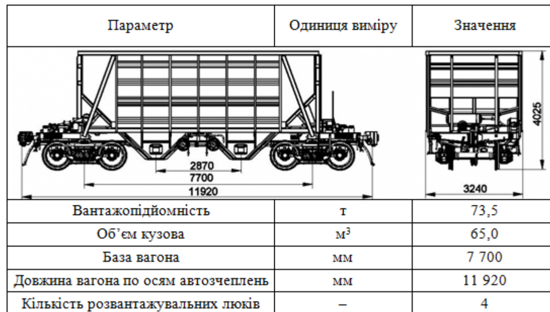
Характеристика вагона – Вагон-хопер для перевезення щебню моделі 19-7154, продукції Крюківського вагонобудівного заводу

Вивантаження щебеню з вагонів-хоперів зазвичай здійснюється через нижні люки під дією сили тяжіння, що дозволяє забезпечити достатню швидкість подачі матеріалу, однак потребує наявності спеціалізованих приймальних пристроїв. У сучасних умовах доцільно відмовитися від застарілих рішень із завальними ямами, які потребують земляних робіт, водовідведення та значних капіталовкладень.