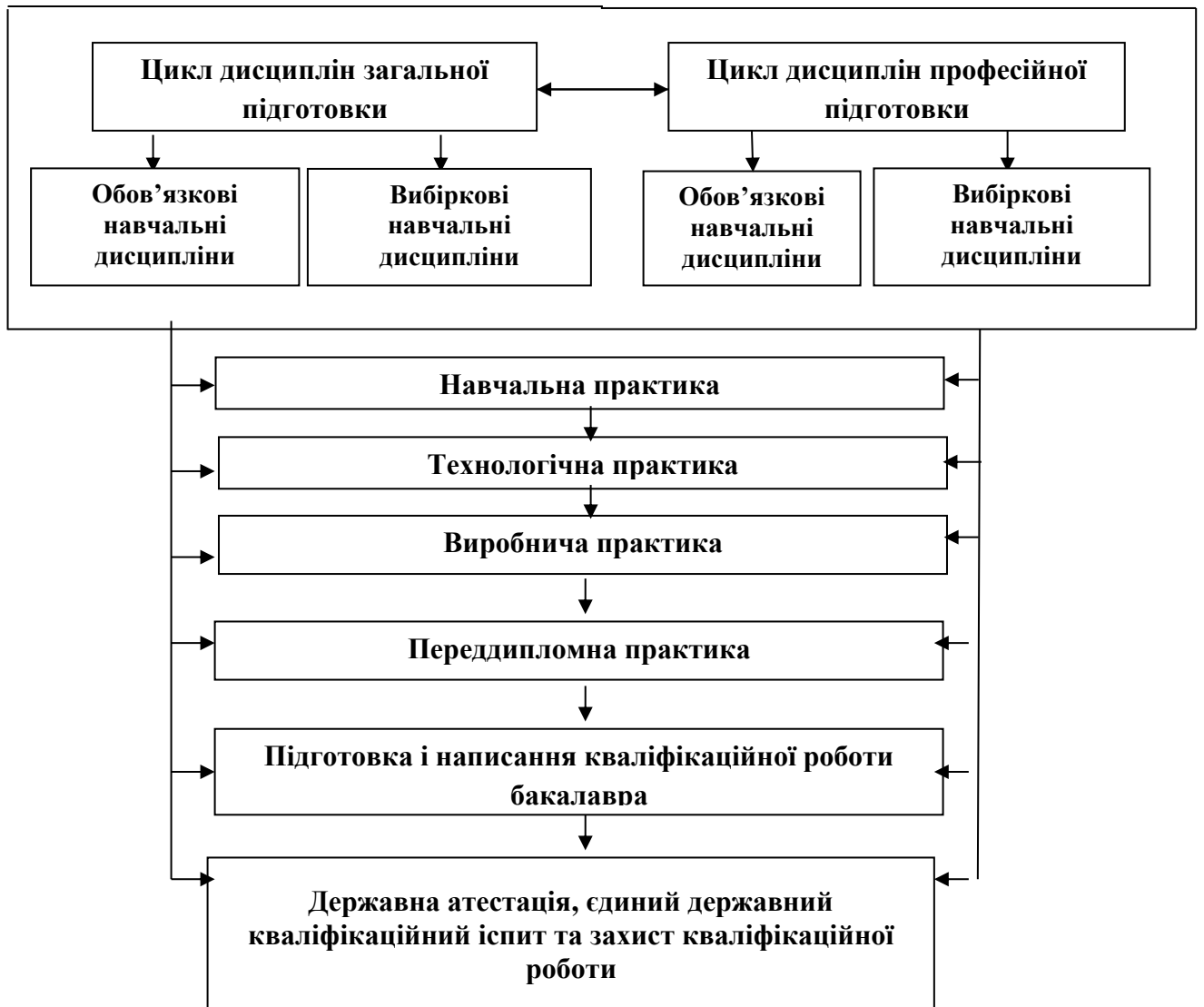
Рисунок 1 – Логічний взаємозв'язок і взаємозумовленість послідовності вивчення циклів навчального плану

Логічний взаємозв'язок і взаємозумовленість послідовності вивчення циклів компонентів навчального плану проілюстровано на рис. 1.