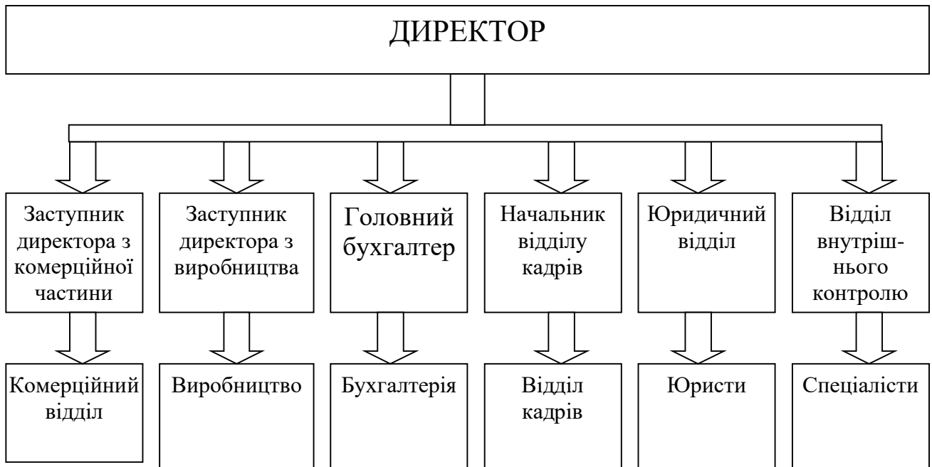
Рисунок 1.1 – Організаційна структура ТОВ «АБВ»