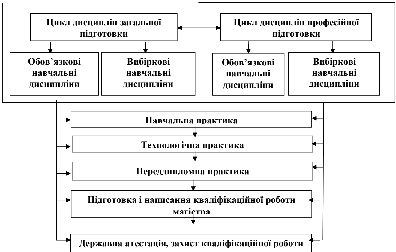
Рис. 1. Взаємозумовленість послідовності вивчення циклів навчальних дисциплін

Вимоги до кваліфікаційної роботи. Кваліфікаційна робота має бути завершеним дослідженням, яке передбачає розв’язання складної спеціалізованої задачі або актуальної практичної проблеми у сфері транспортних технологій (за відповідною спеціалізацією) на основі сучасних економіко-технологічних підходів. Університет забезпечує перевірку кваліфікаційної роботи на плагіат.